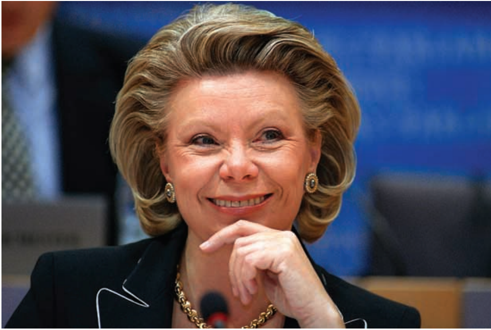
Viviane Reding, Comisarul european pentru Societatea Informațională și Mass-media