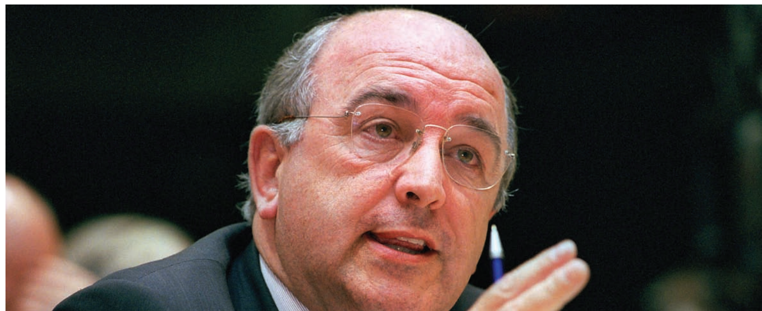
Joaquín Almunia, Comisarul pentru afaceri economice și monetare

O Uniune Europeană extinsă și puternică poate face față mai bine acestei provocări și celorlalte existente, decât statele membre în mod individual. UE a luat măsuri coordonate