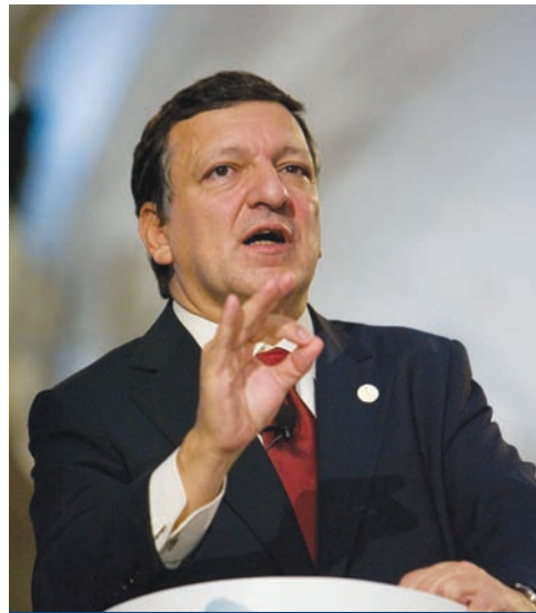
José Manuel Durão Barroso, președinte al Comisiei Europene

În cadrul reuniunii, Comisia și partenerii sociali europeni (CES, Business Europe, CEEP și UEAPME) au convenit asupra necesității de a coopera pentru a menține și a dezvolta în continuare realizările sociale și economice ale Uniunii Europene și ale pieței sale interne ca sursă de prosperitate, creștere și ocupare a forței de muncă în Europa.