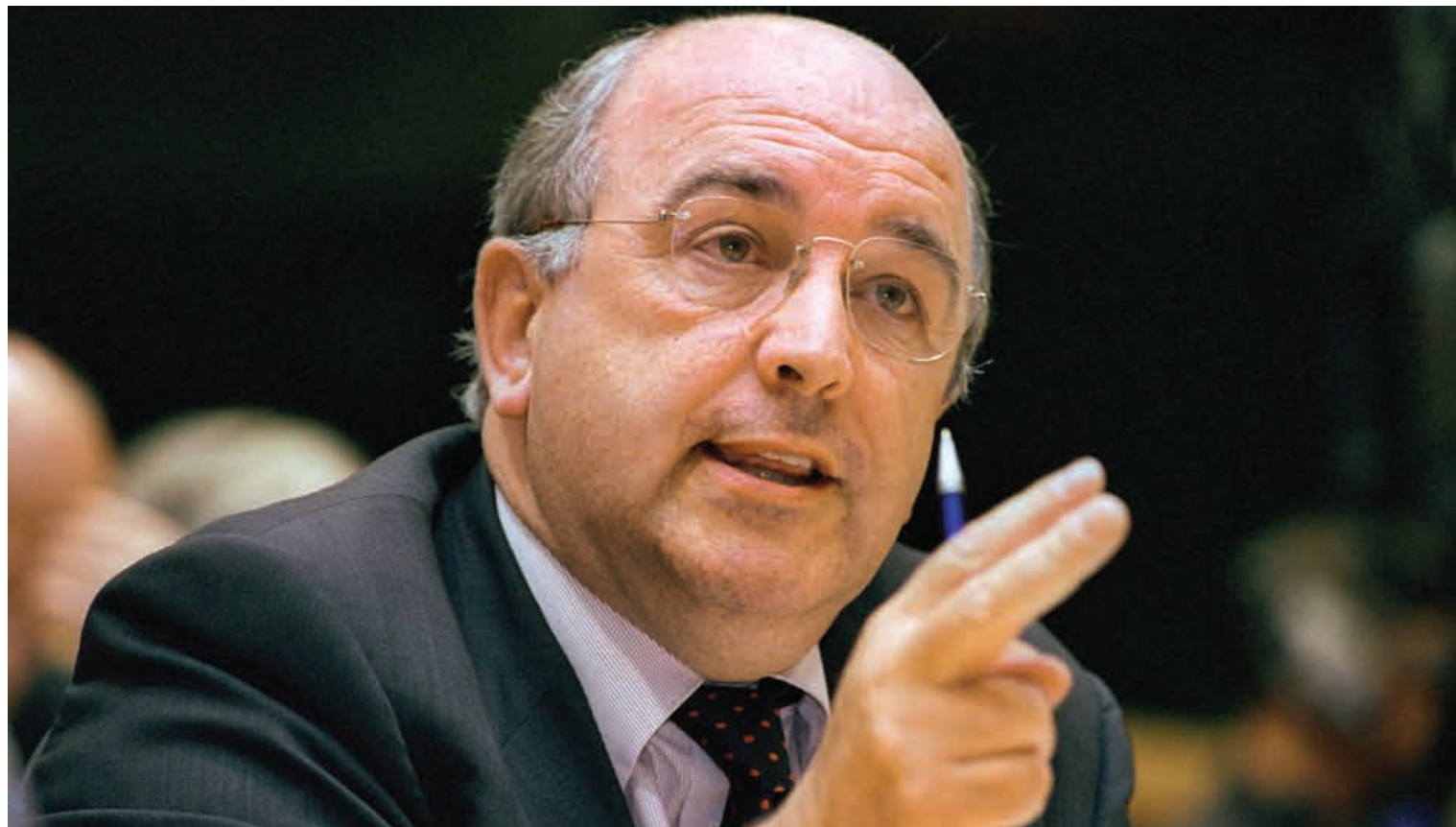
Joaquin Almunia, comisar pentru Afaceri Economice și Monetare